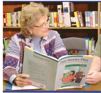
Lewis & Clark Literacy Council